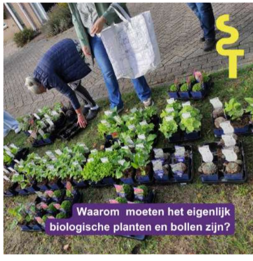
Waarom moeten het eigenlijk biologische planten en bollen zijn?

Zoals je misschien hebt gemerkt zijn we achter de schermen hard bezig om jullie te helpen mooie projecten op te zetten dit jaar. Zo zijn we hard bezig om samenwerkingspartners te vinden die ons kunnen helpen naar zo duurzaam mogelijk vergroenen. Een stap die we graag dit jaar zouden zetten is overstappen naar zoveel mogelijk biologische planten. We vinden het gebruik van biologische planten belangrijk voor zowel mens als dier en snappen dat het krijgen van betaalbare biologische planten soms lastig is met een beperkt budget.