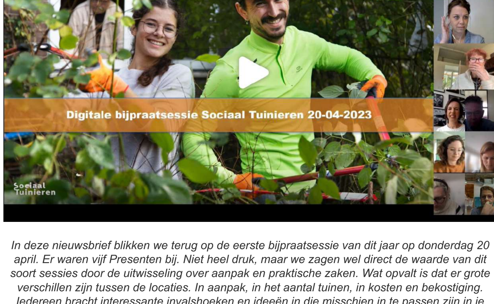
Digitale bijpraatsessie Sociaal Tuinieren 20-04-2023

In deze nieuwsbrief blikken we terug op de eerste bijpraatsessie van dit jaar op donderdag 20 april. Er waren vijf Presenten bij. Niet heel druk, maar we zagen wel direct de waarde van dit soort sessies door de uitwisseling over aanpak en praktische zaken. Wat opvalt is dat er grote verschillen zijn tussen de locaties. In aanpak, in het aantal tuinen, in kosten en bekostiging. Iedereen bracht interessante invalshoeken en ideeën in die misschien in te passen zijn in je eigen aanpak. Het biedt sowieso inspiratie. We benoemen in deze nieuwsbrief een paar dingen die opvielen en vertellen kort iets over de gesprekken over fondsenwerving en stimuleren van biodiversiteit en ecologisch tuinieren. Tot slot vind je een jaarkalender voor bijpraatsessies. Wil je de hele bijpraatsessie van iets meer dan een uur terugkijken? Ook dat kan! Klik dan hier .